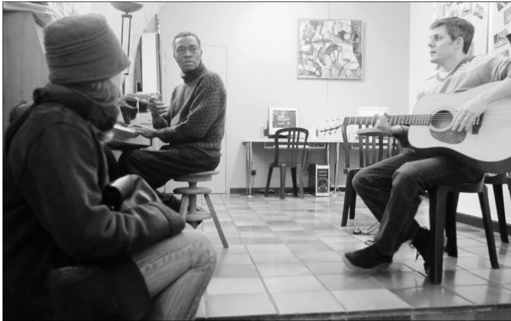
Le bistrot dédié aux personnes « en rupture » a été maintenu, malgré « la mort annoncée de l'association » en 2009.