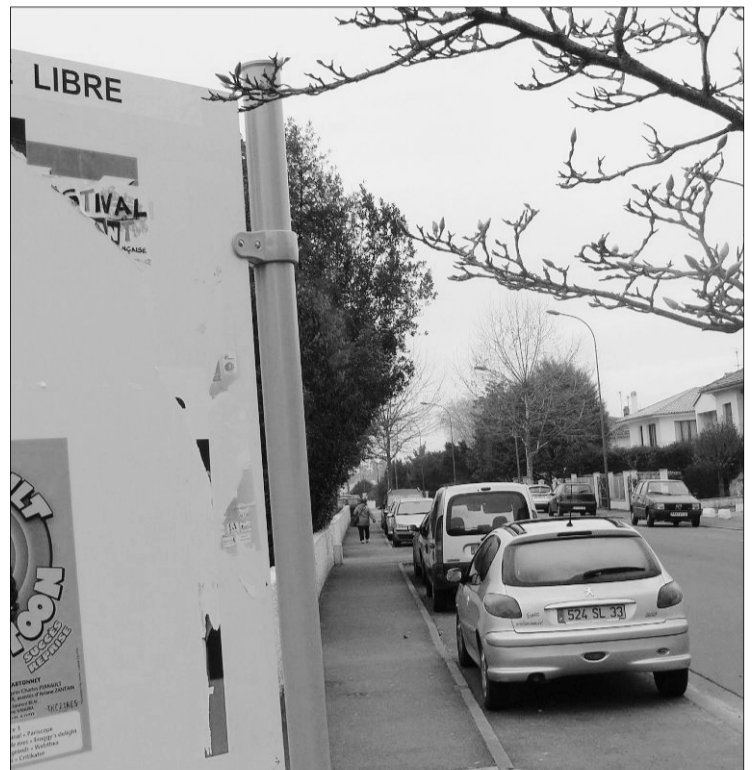
Huit emplacements sont aujourd'hui à l'expression libre contre 21 précédemment. PHOTO L.B.

Tant pis pour les candidats aux régionales qui devront se serrer les coudes pour trouver de la place. « En dehors des périodes électorales, ce sont des entreprises de communication qui s'en servent »,